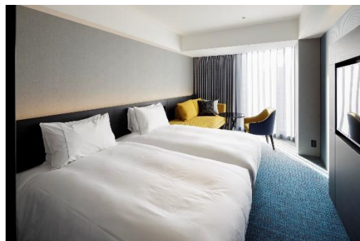
客室 モデレートツインルーム

また、プレミアムなコンセプトルームを 5 部屋 (3 タイプ) ご用意。天高が約 4m と開放感にあふれており、贅沢なひと時をお過ごしいただけます。コンセプトルームには、共通のアメニティサービスに加えて、「朝日焼カップ&ソーサー」「NESPRESSO (ネスプレッソ) コーヒーメーカー」「SUMERAGI スパークリングワイン&梅サイダー」「バルミュダ社製 Bluetooth スピーカー」「ReFa FINE BUBBLE PURE (リファファインバブルピュア) シャワーヘッド」と、各部屋のテーマに合わせて特別に調合したアロマをお楽しみいただけるディフューザーなど、最高級のアイテムを揃えておもてなしいたします。