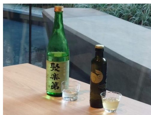
ウエルカムドリンク