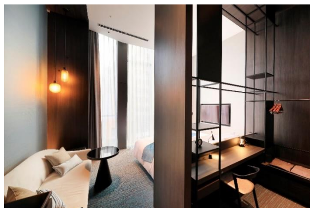
客室 Room“SESERAGI” (天井高 4m 超の特別客室)