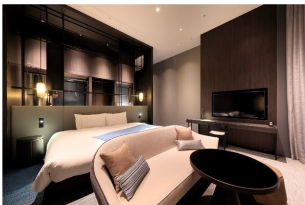
客室 Room“UTSUROI” (天井高 4m 超の特別客室)

また、プレミアムなコンセプトルームを 5 部屋 (3 タイプ) ご用意。天高が約 4m と開放感にあふれており、贅沢なひと時をお過ごしいただけます。コンセプトルームには、共通のアメニティサービスに加えて、「朝日焼カップ&ソーサー」「NESPRESSO (ネスプレッソ) コーヒーメーカー」「SUMERAGI スパークリングワイン&梅サイダー」「バルミュダ社製 Bluetooth スピーカー」「ReFa FINE BUBBLE PURE (リファファインバブルピュア) シャワーヘッド」と、各部屋のテーマに合わせて特別に調合したアロマをお楽しみいただけるディフューザーなど、最高級のアイテムを揃えておもてなしいたします。