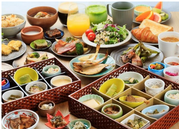
リッチモンドホテルプレミア京都四条 朝食「京イタリアン ビュッフェ」

ロイヤルホールディングス株式会社でホテル事業を担うアールエヌティーホテルズ株式会社は、2023年7月1日（土）より、「リッチモンドホテルプレミア京都四条」と「リッチモンドホテルプレミア京都駅前」において、朝食やラウンジサービスの相互利用を開始します。