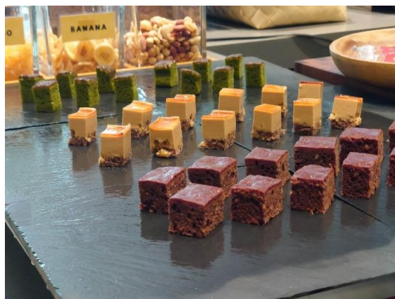
ラウンジサービス 甘味 (例)