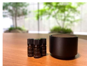
各部屋のテーマに合わせて調合した アロマとディフューザー