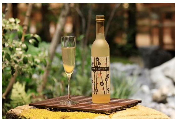
ラウンジサービス アルコール (例)