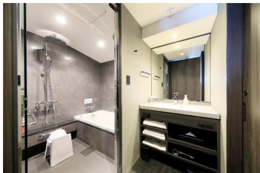
浴室・トイレ・洗面台が独立

観光での利用にぴったりのゆったりとした客室は全 11 タイプご用意。全客室ベッドはシモンズ社製を導入し、ユニバーサルツインルーム以外の客室はすべて、浴室、トイレ、洗面台が独立した室内で、上質な心地よさとくつろぎのひとつときを提供します。ロビー、プレミアラウンジ、客室(一部)などから季節により異なる表情を見せる中庭が望めます。