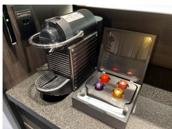
NESPRESSO コーヒーメーカー