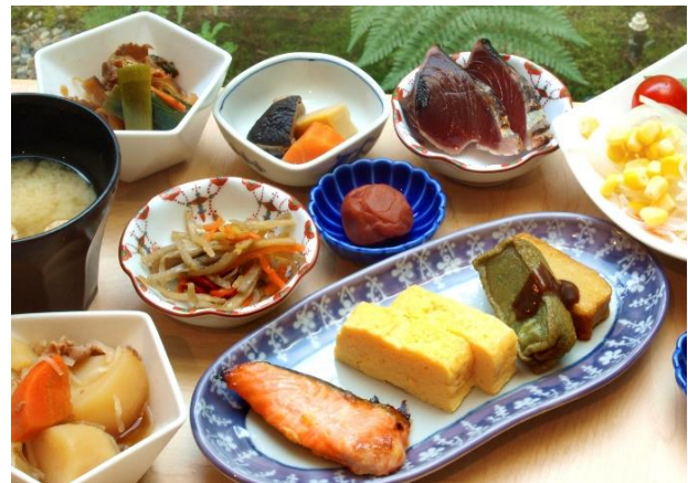
リッチモンドホテルプレミア京都駅前 朝食「京おばんざい ビュッフェ」

京都府内では「リッチモンドホテルプレミア京都駅前」が京都駅から徒歩5分に位置し、2022年3月に開業をした2棟目となる「リッチモンドホテルプレミア京都四条」は、京都市を代表する繁華街がある四条駅、烏丸駅から徒歩7分という立地で、観光やビジネスの拠点として幅広いニーズに 대응しています。