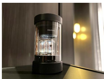
バルミュダ社 Bluetooth スピーカー