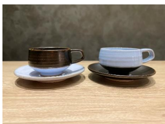
朝日焼カップ&ソーサー