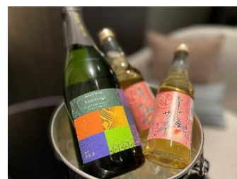
SUMERAGI スパークリングワイン&梅サイダー