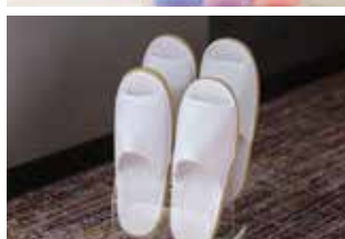
右上 ミキモトコスメティックス 右下 洗い立てスリッパ