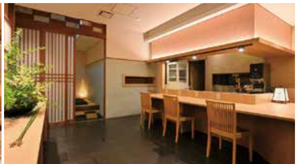
落ち着いた雰囲気の内