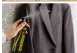
左上 アメニティバー 左下 消臭スプレー