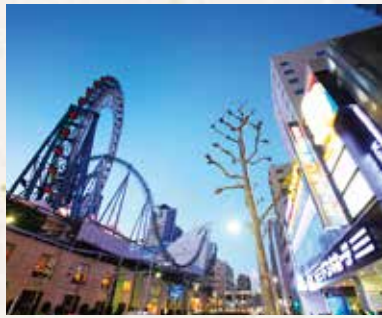
ホテルと東京ドームシティ

リッチモンドホテル東京水道橋は、JR中央・総武線「水道橋駅」より徒歩8分、都営地下鉄三田線「水道橋駅」より徒歩5分、東京メトロ丸の内線「後楽園駅」より徒歩5分です。各沿線へ乗り入れやすいため多方面への移動が大変便利です。 ホテルから徒歩約5分、東京ドームシティは遊園地、ショッピングなど家族や友人と楽しめるエリアです。 文京区の街並みを約10分散策すれば東京都水道歴史館へ向かうことができます。江戸から400年の東京水道の歴史を分かりやすく展示しています。安全でおいしい水を届けている技術や設備をご覧いただけます。 小石川後楽園は東京に居ながら中国調の庭園を楽しむことができる公園です。園内にある涵徳亭（かんとくてい）ではお庭を見ながらお食事ができます。