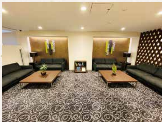
アーバンスタイルのロビー

東京時間を楽しむお客さまをお迎えする リッチモンドホテル東京水道橋のロビーで はアーバンな雰囲気を感じながらチェック インを行っていただけます。 遊園地やショッピングなど東京を遊びつ くす旅行、歴史情緒を感じる静かで趣のある 旅行、どちらも楽しめるエリアの中心に リッチモンドホテル東京水道橋があります。 洗練されたロビー、客室のしつらえ、使 い勝手の良い客室設備は旅の疲れをここと よく癒してくれるはずです。 旅行にはもちろんのこと、ビジネスの拠 点としても便利な立地にあるホテルです。 スタッフ一同お待ちしております。