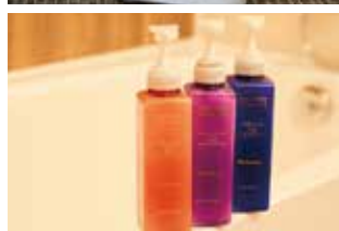
右上 加湿機能付空気清浄機 右下 MIKIMOTO パスセット