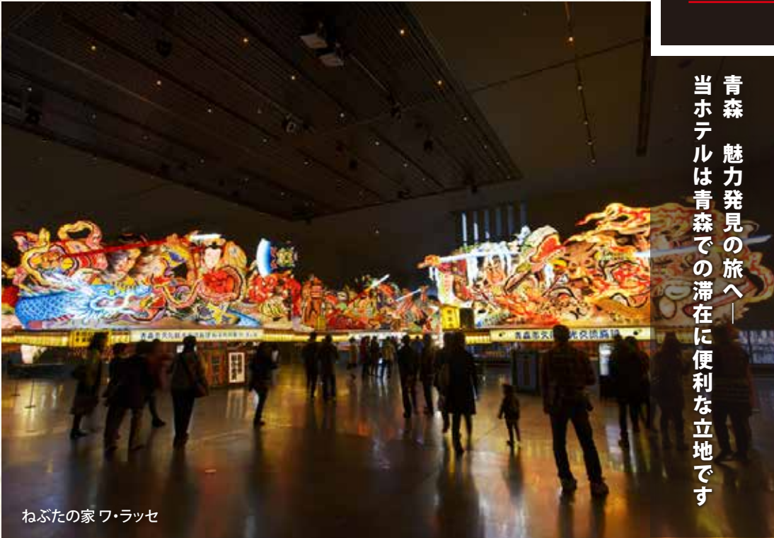
ねぶたの家ワ・ラッセ

青森駅東口から車で5分、青森空港連絡バス「柳町通り」下車にて徒歩1分の場所に当ホテルはございます。