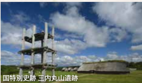
国特別史跡 三内丸山遺跡

青森県観光物産アスパムはホテルから徒歩約10分です。青森県の観光と物産の情報基地。十和田湖やねぶたなどを臨場感あふれる360度マルチスクリーンで紹介するパノラマ館や展望台などがあります。