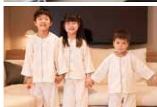
左上 マイナスイオンドライヤー 左下 子供用ルームウェア