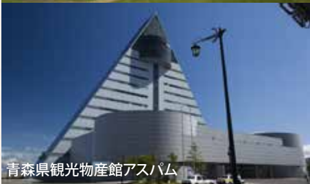
青森県観光物産館アスパム