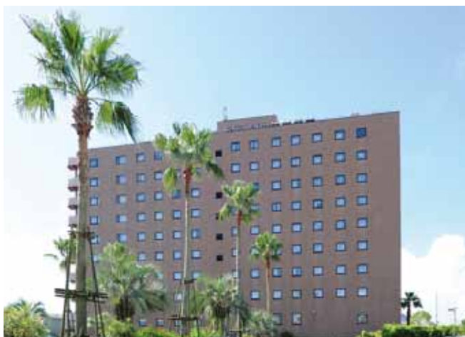
道の駅フェニックス

現代的で洗練された中にも、温かみのある心通わせるおもてなしで皆さまをお迎えいたします。